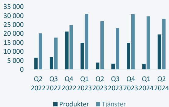
Omsättning per kvartal, TSEK Q2 2022 – Q2 2024